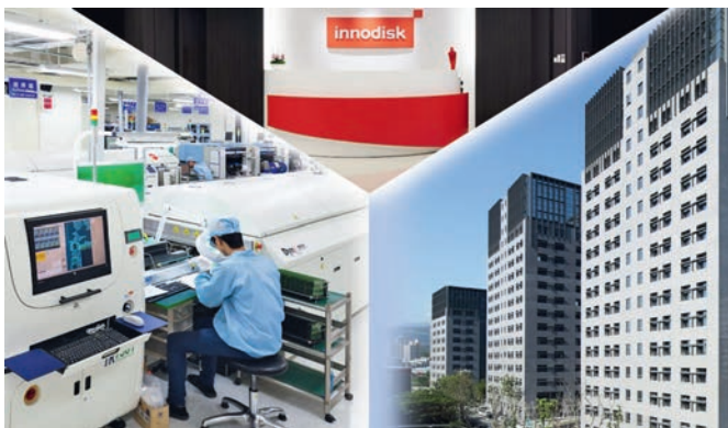
Рис. 1. Офис и завод Innodisk на Тайване

За свою историю компания подготовила и зарегистрировала более 50 патентов на свои продукты и инновации — на Тайване, в Китае, Японии и США. В частности, Innodisk был одним из первых производителей, представивших на рынке компактные твердотельные диски