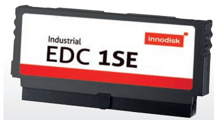
Рис. 2. Твердотельный накопитель с интерфейсом IDE