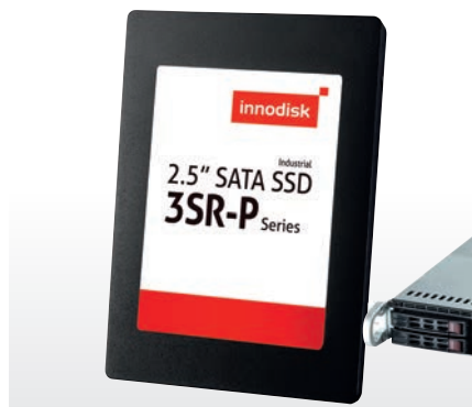
Рис. 5. SSD-накопители формата 2,5"

Если говорить об отдельных категориях продукции компании Innodisk, то 2,5" SSD-накопители наряду с картами памяти формата CompactFlash – наиболее востребованные флэш-устройства как во всём мире, так и в России (рис. 5). Кроме того, на глобальном рынке встраиваемых систем и промышленных серверов наблюдается устойчи-