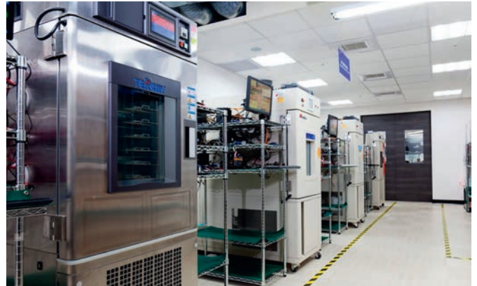
Рис. 4. Испытательное оборудование на производстве Innodisk

с интерфейсом IDE (рис. 2). Эта разработка позволила применять SSD-накопители в системах, не имеющих специализированного разъёма. В дальнейшем эта концепция легла в основу разработки формата флэш-накопителей SATADOM для стандартного разъёма SATA.