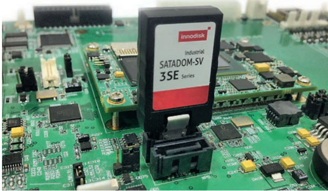
Рис. 3. Накопитель SATADOM с технологией питания Pin 7 VCC