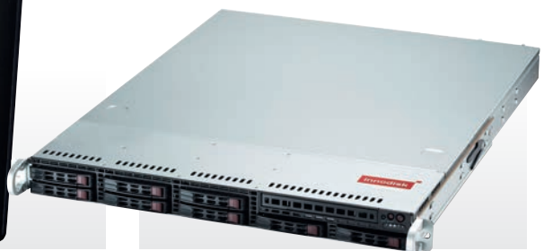
Рис. 6. Система хранения данных FlexuArray