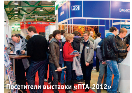
Посетители выставки «ПА-2012»

В секции «Встраиваемые системы» выступили специалисты компаний-лидеров этого сегмента на отечественном рынке: SWD Software, «СВД Встраиваемые Системы», «Кварта Технологии». Представители компании FASTWEL рассказали о заказных изделиях на базе