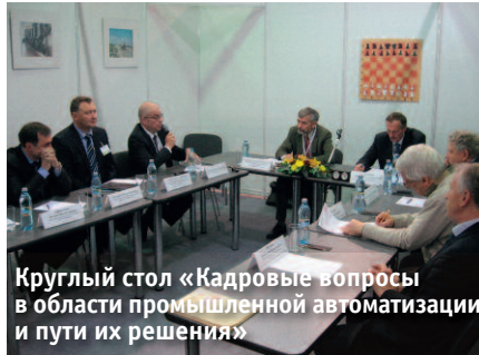
Круглый стол «Кадровые вопросы в области промышленной автоматизации и пути их решения»

делились достижениями за 20 лет и поведали о перспективах, но и представили свой проект «ЭнергоГород» — масштабируемое комплексное решение задач энергосбережения, за который им присудили диплом на конкурсе журнала «СТА».