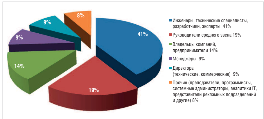
Рис. 1. Должностной состав посетителей выставки «ПТА-2012»

Выставка «ПТА» в Москве, как и другие проекты компании «ЭКСПОТРОНИКА», отличается от мероприятий конкурентов качественным составом своих посетителей. Это исключительно специалисты рынка автоматизации — руководители отделов КИПиА, АСУ ТП, конструкторских бюро, инженеры,